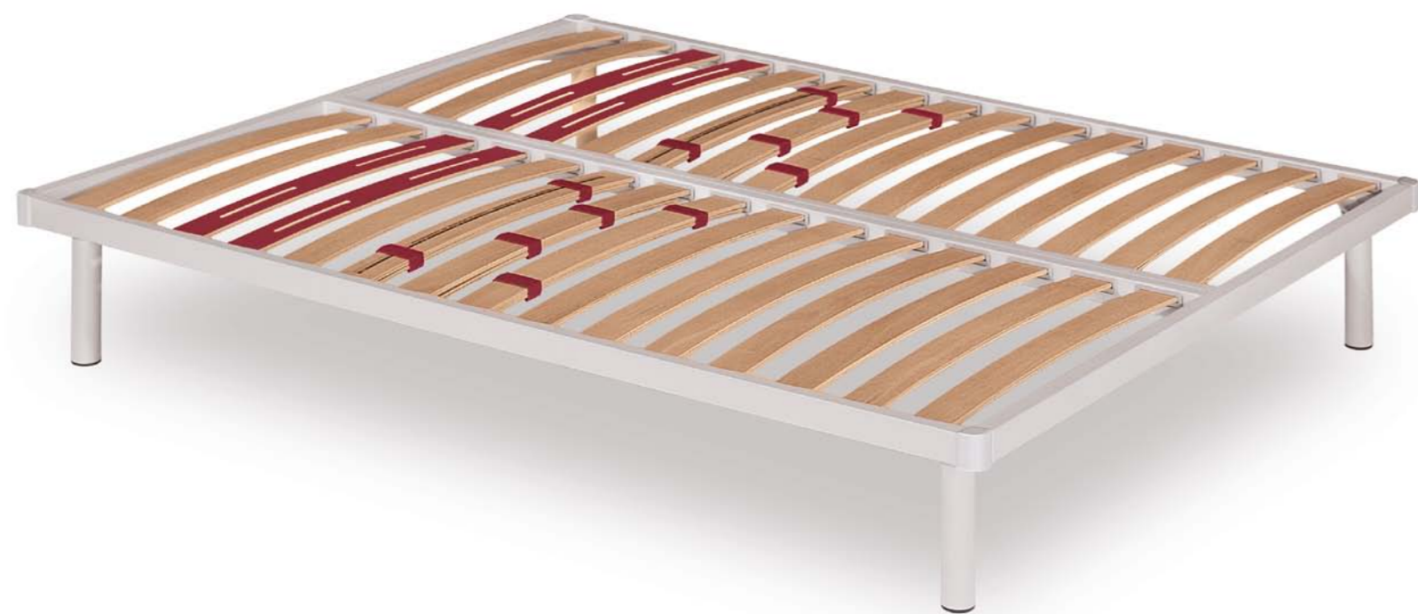
Altezza finita 30/35/40