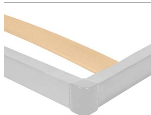
Particolare del profilo in acciaio

profilato metallico saldato dritto con sezione 50x30 mm a vista, con doppia barra longitudinale ed angolari di finitura in materiale plastico in contrasto. Sistema monodoga da 68 mm inserite nel telaio, 2 colorate e fresate per la zona spalle e 3 doghe con regolazione di rigidità. Completa di piedini avvitabili in metallo Ø50 mm.