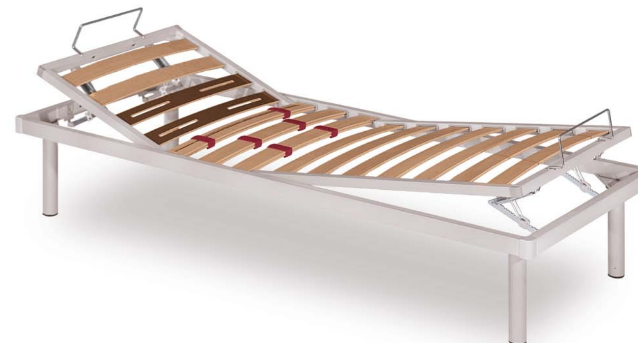
* prezzo composto da 2 reti singole

profilato metallico saldato dritto con sezione 50x30 mm a vista ed angolari di finitura in materiale plastico in contrasto. Sistema monodoga da 68 mm inserite nel telaio, 2 colorate e fresate per la zona spalle e 3 doghe con regolazione di rigidità. Completa di piedini avvitabili in metallo Ø50 mm. Sistema alza piedi e testa manuale.