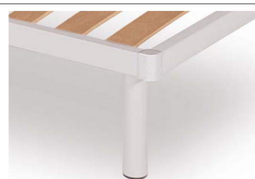
Particolare piedini metallo. Altezza finita 30 - 35 - 40